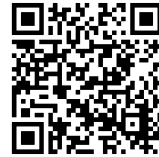
むつ工同窓会ページ QRコード

むつ工同窓会会報は「むつ工業高校ホームページ」に掲載されております。維持費を納入された方々や新卒者の皆様には、印刷した会報をお届けいたしますが全ての同窓生の方々に印刷した会報を配付していません。同窓会ページのQRコードを掲載しますので、そこからご覧ください。また、同窓会からのお知らせやお願いも掲載されておりますので合わせてご覧ください。同窓生の皆様にはご理解、ご協力の程よろしくお願いいたします。